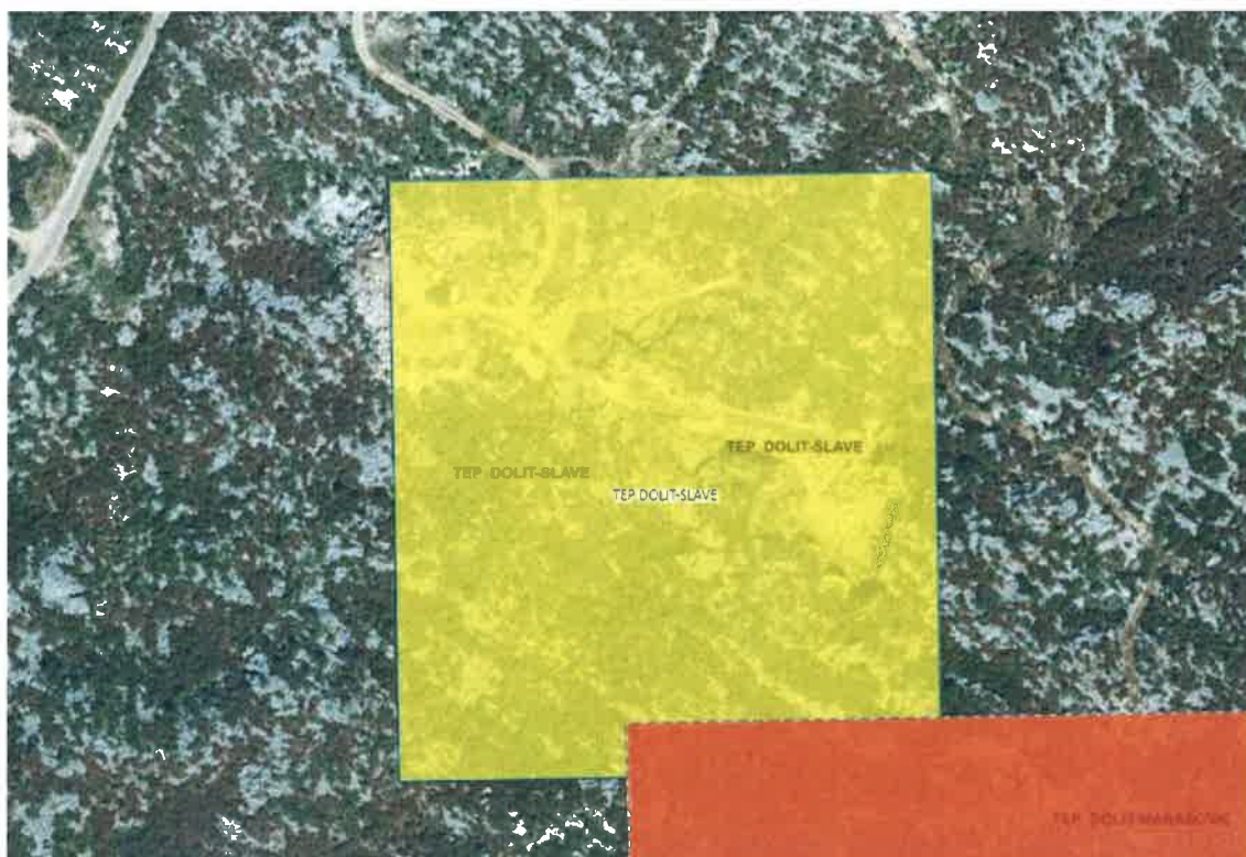
Grafički prikaz eksploatacijskog polja arhitektonsko-građevnog kamena “Dolit-slave”